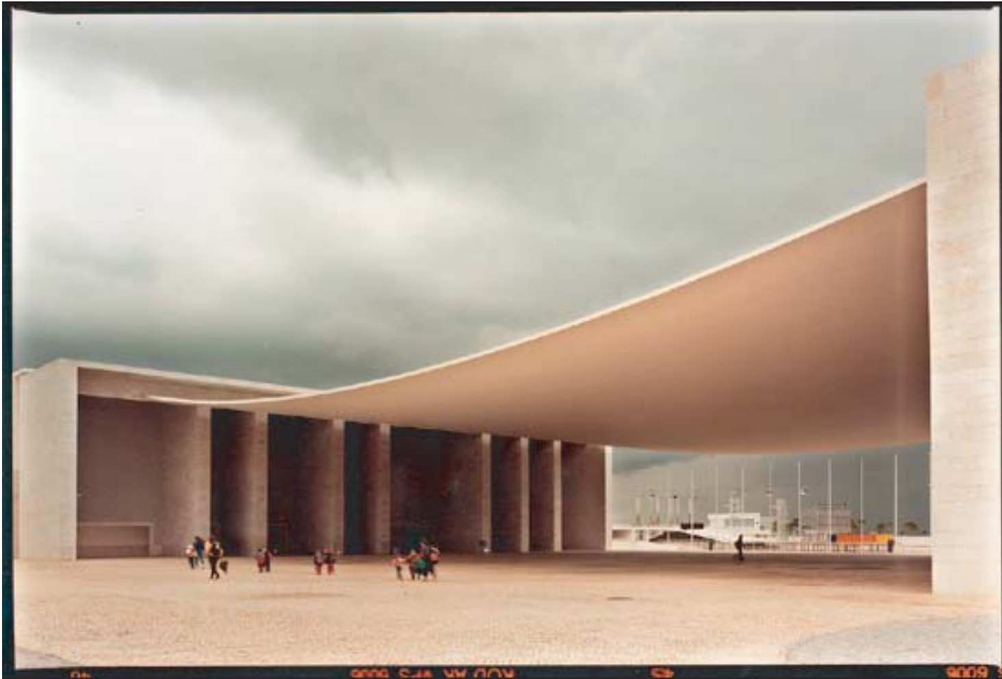
Álvaro Siza Vieira: padiglione del Portogallo all'Expo 98, Lisbona