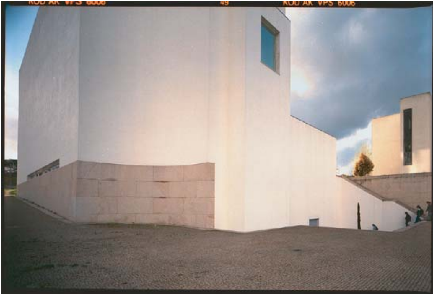
Álvaro Siza Vieira: chiesa parrocchiale, Marco de Canavezes