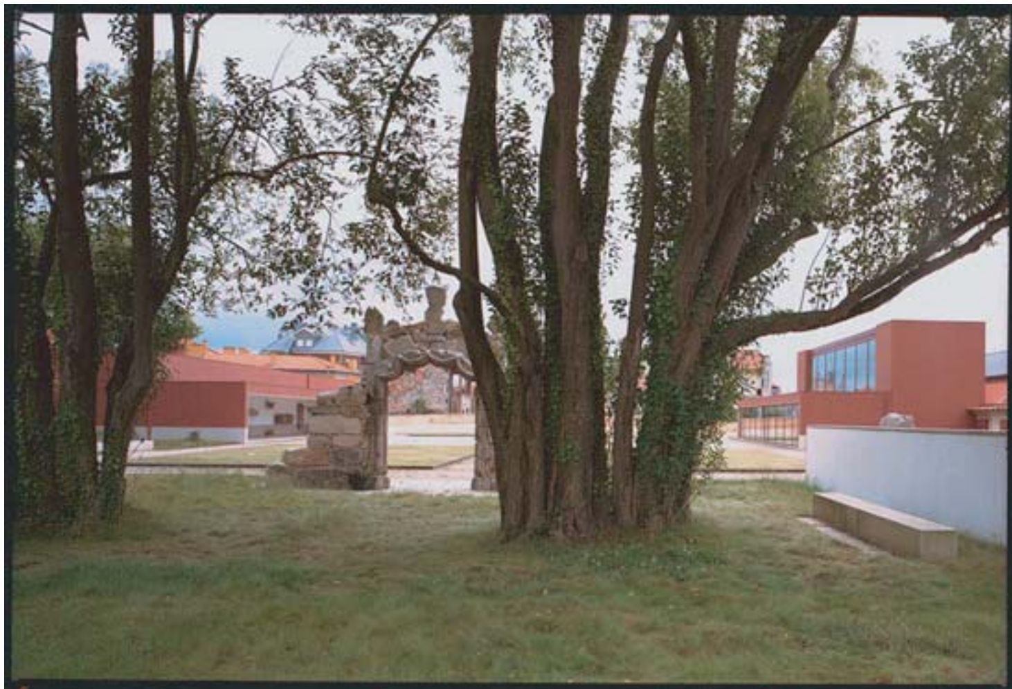
Fernando Távora: museo Soares dos Reis, Porto