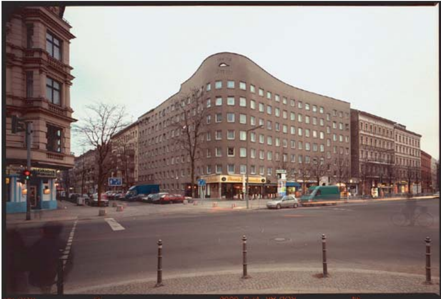
Álvaro Siza Vieira: complesso residenziale Bonjour Tristesse, Berlino