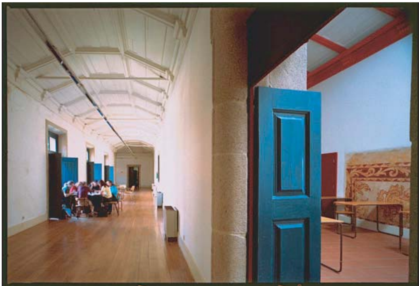
Fernando Távora: scuola di Agraria, Ponte de Lima