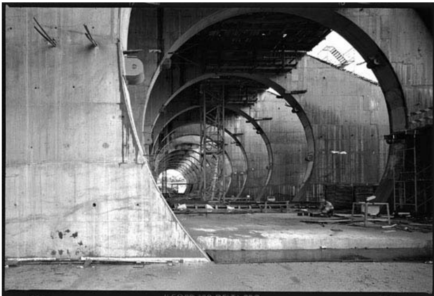
Eduardo Souto de Moura: nuovo stadio, cantiere, Braga