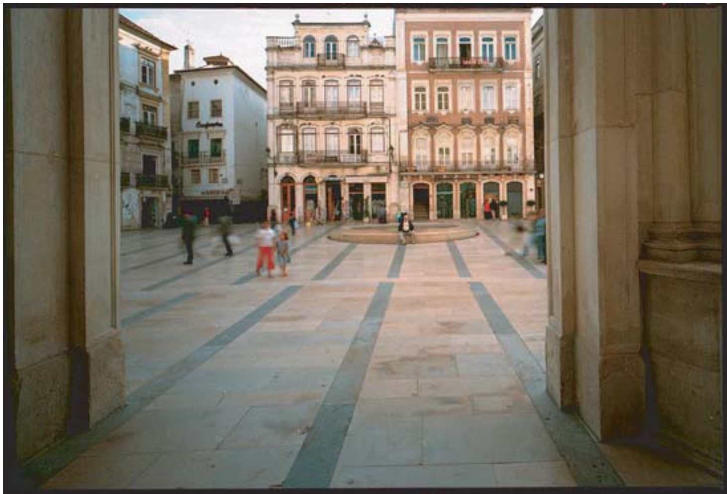
Fernando Távora: piazza 8 maggio, Coimbra