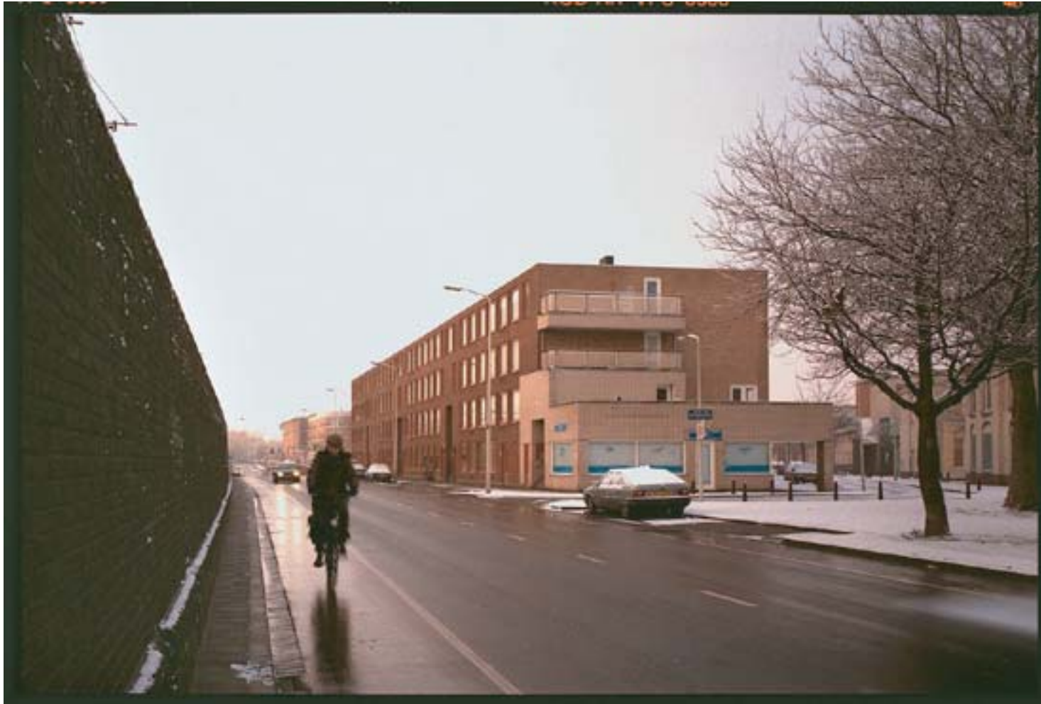
Álvaro Siza Vieira: abitazioni sociali De Punkt en De Komma, L'Aja