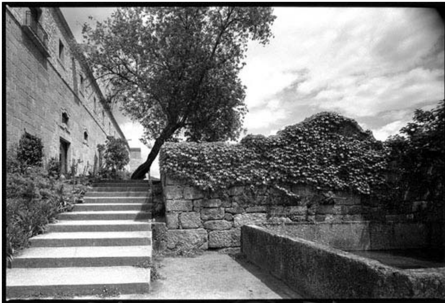
Eduardo Souto de Moura: Pousada S. Maria do Bouro, Amares