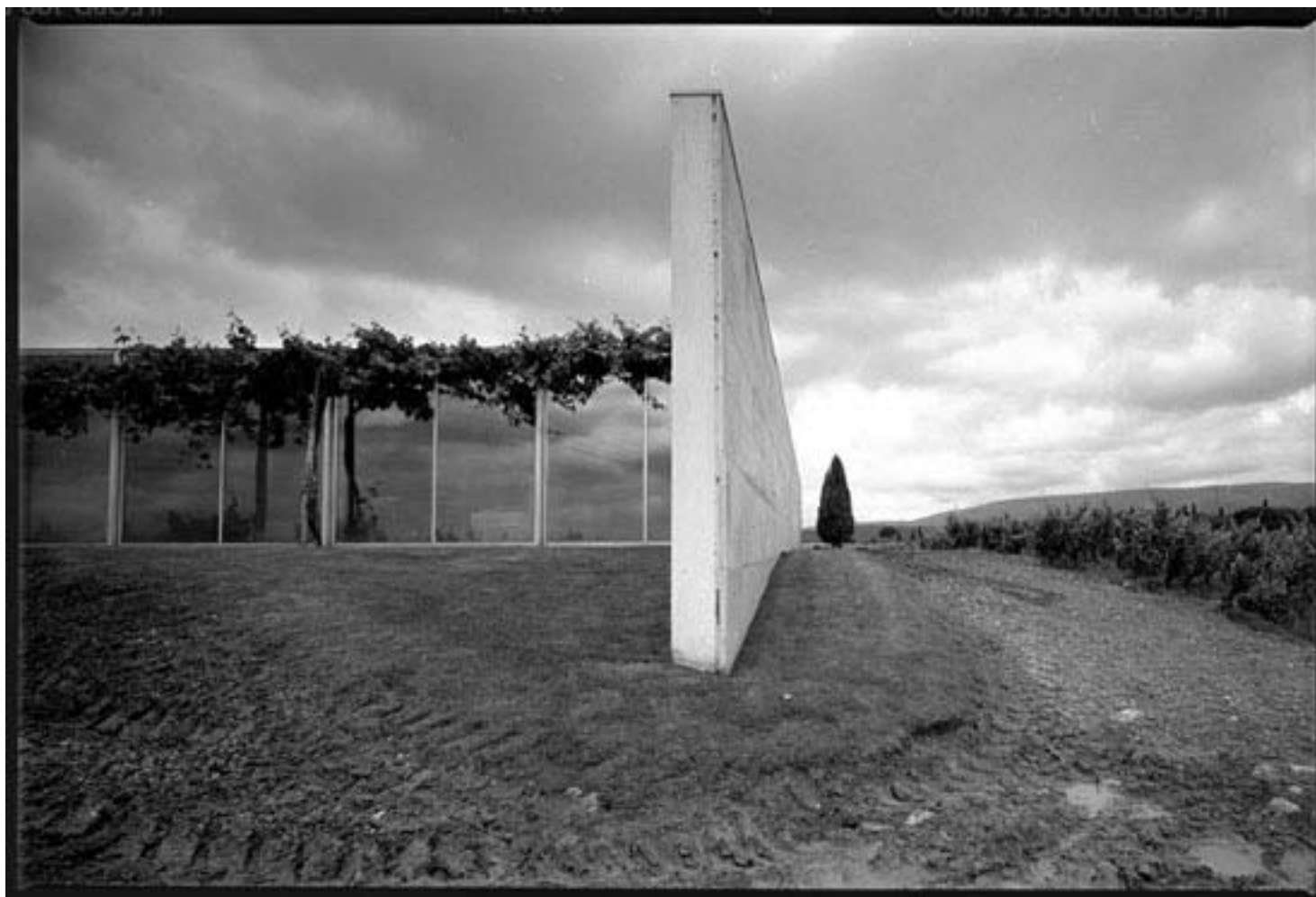
Eduardo Souto de Moura: casa ad Alcanena, Torres Novas