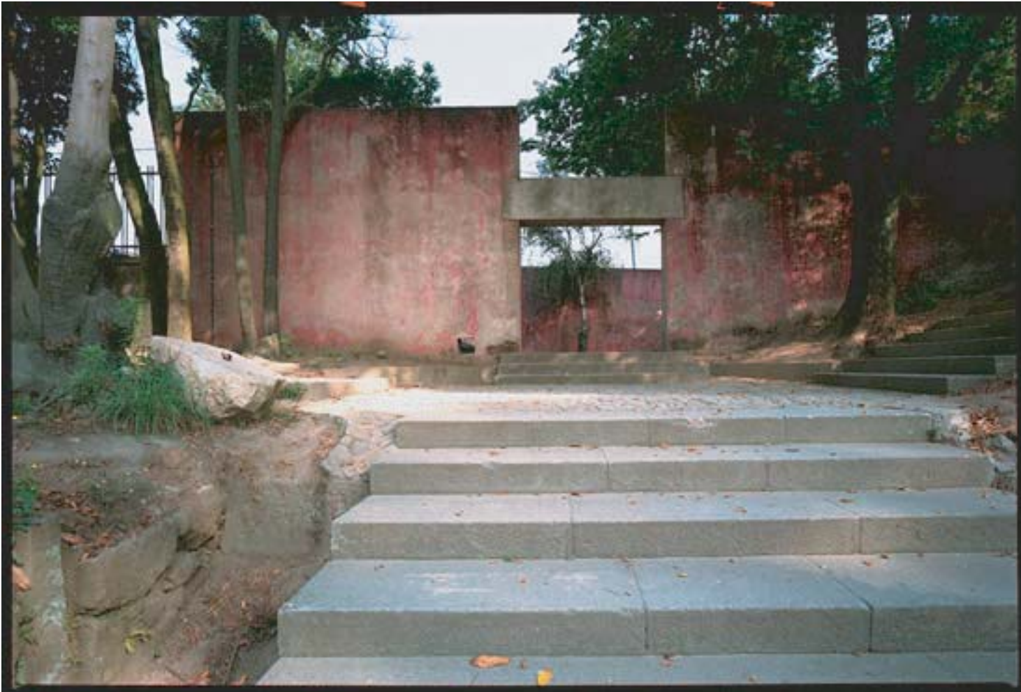
Fernando Távora: parco della Quinta de Conceição, Matosinhos